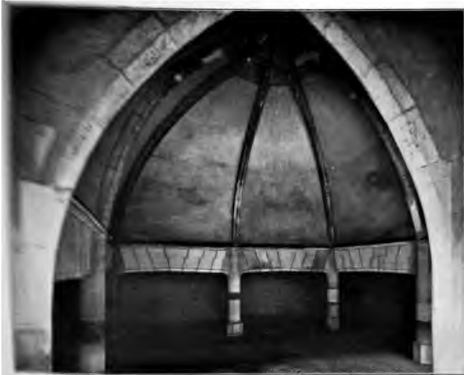
Guide des Monuments Historiques

« ... despend par quantité ». Pour découvrir ces victuailles, les cuisiniers, les servirs, existe tout un personnel domestique : d'abord le valet de chambre et l'écuyer tranchant ; ensuite les écuyers de cuisine qui tiennent en règle les comptes de la cuisine et doibvent savoir comment elle est dépensée et la dépense qui se fait » ; enfin